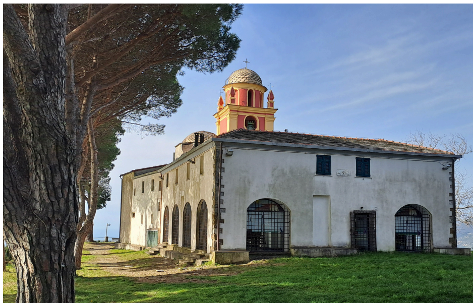
LA SCALA SANTA E IL SANTUARIO DI NOSTRA SIGNORA DI MONTENERO